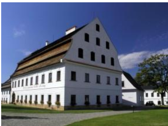
Obr. 1 Ruční papírna ve Velkých Losinách