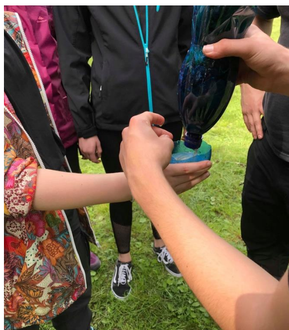
A dokonce i filtrovat vodu z kaluže (kterou se ale nikdo neodvážil vypít)

Potom přišla řada na stavbu příbytku, ve kterém strávíme noc. Tu noc mělo pršet, takže jsme se museli zaměřit na co nejlepší postavení střechy, která nás musela ochránit v suchu. Využili jsme stromů, plachet, klacků a rostlin.