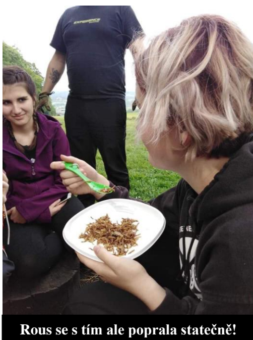
Rous se s tím ale poprala statečně!

Jelikož byla Rous tak hodná, rozdělila se s námi. Skoro všichni si na červy troufli a dokonce i já. Nechutnalo to špatně, ale byl to divný pocit, jíst červy. Někteří tedy jen ochutnali a jiným to dokonce zachutnalo tak, že to jedli s chlebem. Tato zkušenost je rozhodně nezapomenutelná.