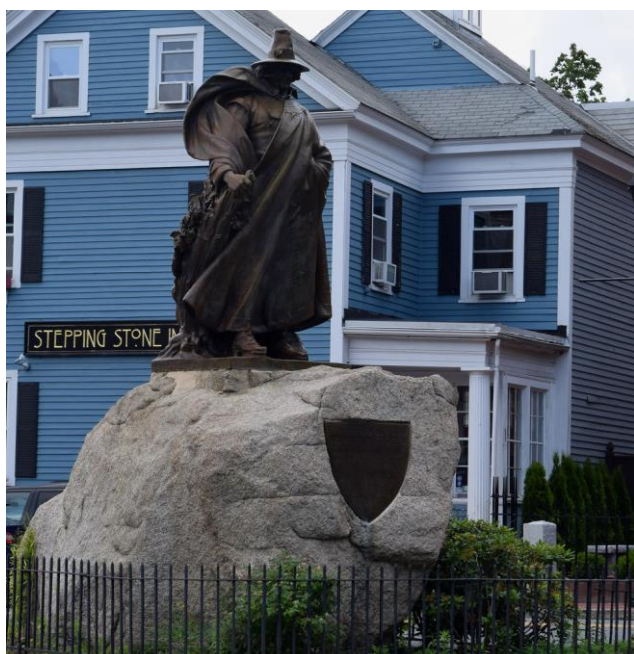
Roger Conant-zakladatel Salemu

-V muzeu probíhá také mnoho akcí. Autorské čtení s autory, pochody, filmové večery, vyprávění příběhů. V Muzeu si můžeme také koupit mnoho suvenýrů mezi nimiž patří příručky, dekorace, oblečení, doplňky.