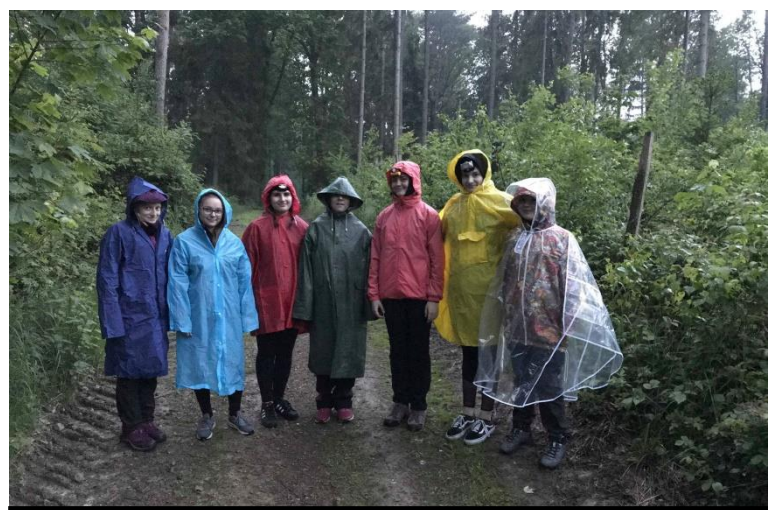
Snad se nás pan na rozvážení pizzy moc nelekl.

Po jídle jsme se snažili osušit u ohně a povídali si. Čas ke spánku se kvapem blížil. Déšť neustával, ale my stejně jako správní zálesáci si šli lehnout, abychom se vyspali. V tom počasí to bylo docela těžké, spacák občas promokl, nebo nás přepadla zima, i tak jsme se ale tak nějak vyspali