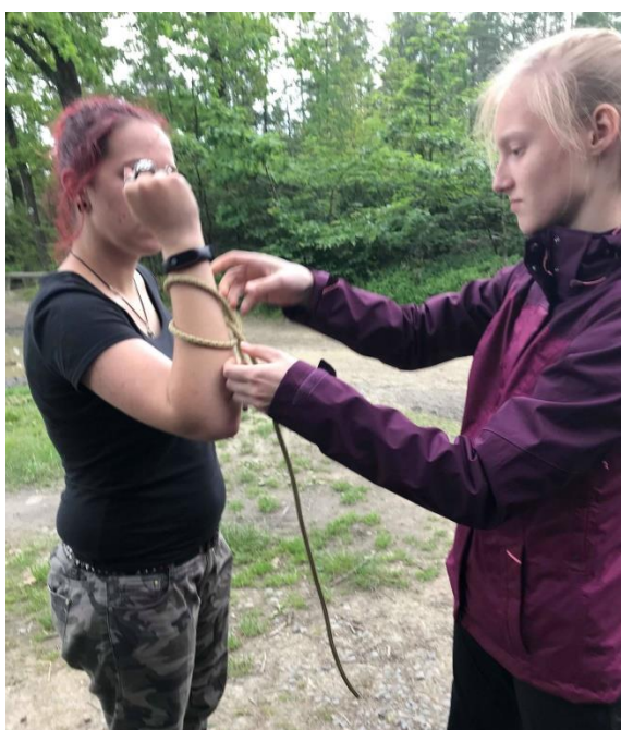
Naučili jsme se udělat několik druhů suků.

Začalo to docela nevinně; prvně jsme se naučili základy sebeobrany, základy orientování se v terénu, způsoby obživy, rozdělávání ohně apod.