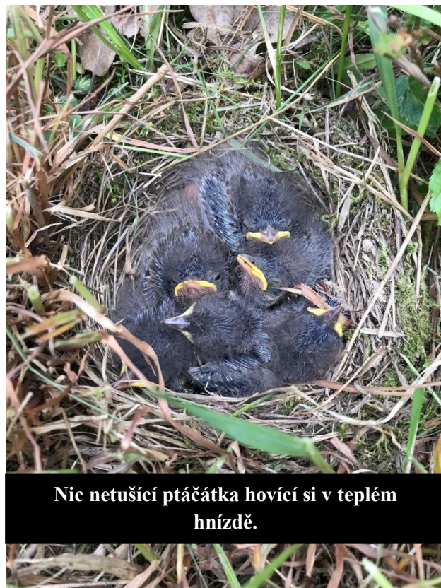
Nic netušící ptáčátka hovíci si v teplém hnízdě.

Jakmile přístřešek stál, vydali jsme se na několik kilometrů dlouhou procházku lesem do nedaleké vesnice. Na cestě zpět jsme šli polem a objevili mlád'átka nějakého polního ptáka. Měla štěstí, protože pár hodin předtím na poli sekali trávu.