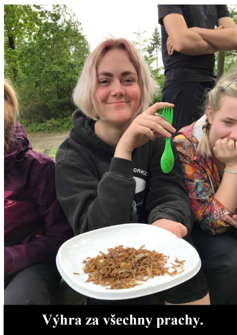
Výhra za všechny prachy.