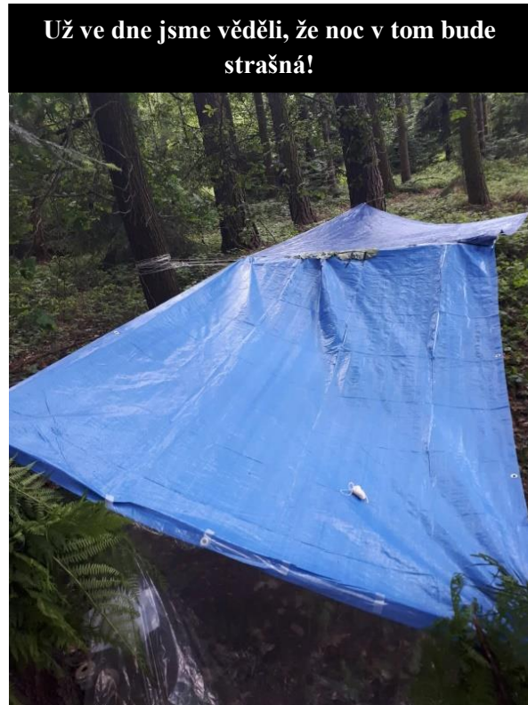
Už ve dne jsme věděli, že noc v tom bude strašná!

Jakmile přístřešek stál, vydali jsme se na několik kilometrů dlouhou procházku lesem do nedaleké vesnice. Na cestě zpět jsme šli polem a objevili mlád'átka nějakého polního ptáka. Měla štěstí, protože pár hodin předtím na poli sekali trávu.