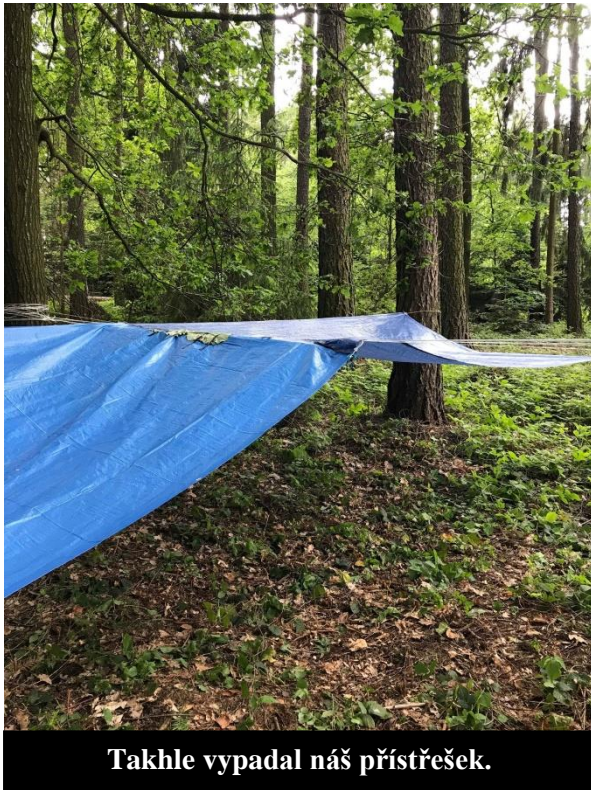
Takhle vypadal náš přístřešek.