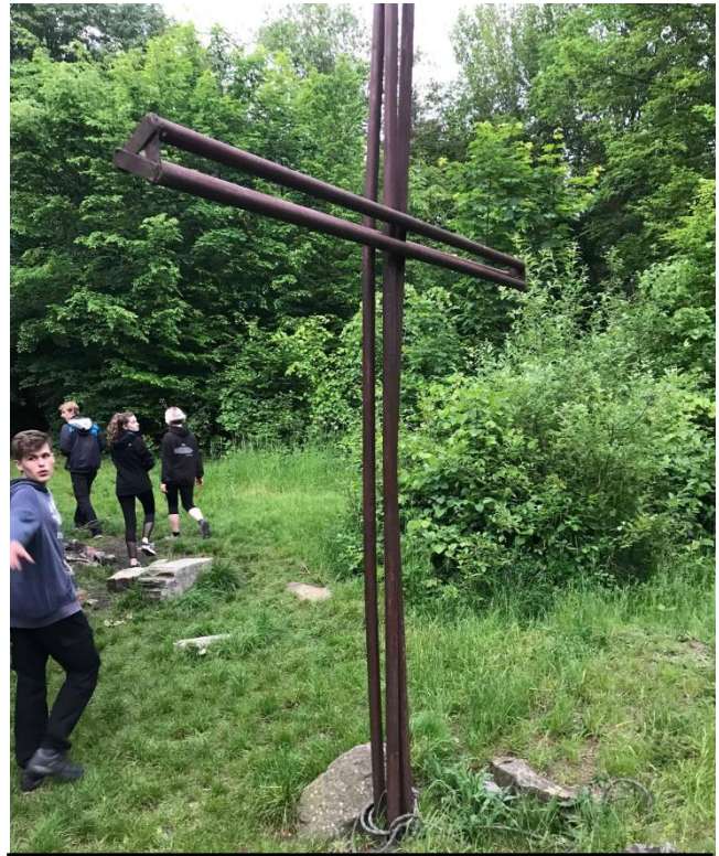
Výprava za historií...