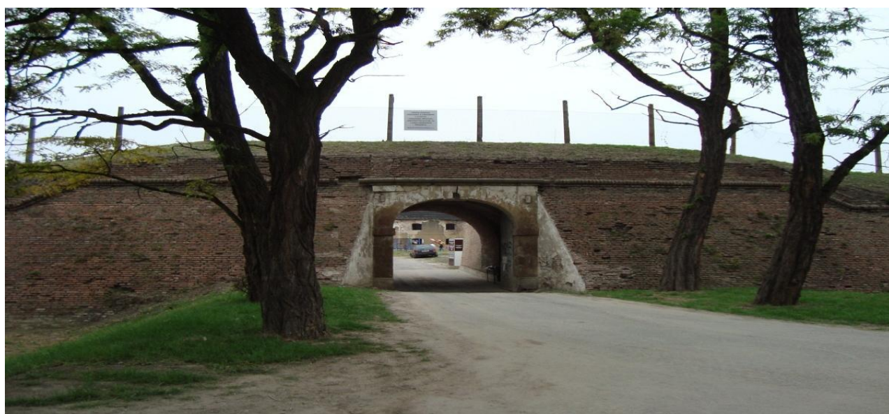
Vjezd do Korunní pevnůstky

Pevnost poznání se nachází v bývalém dělostřeleckém skladu. Pevnost poznání je pro lidi od pěti až po sto let. V muzeu je připraveno více než 200 velice zábavných exponátů, dílny pro zajímavé pokusy, velký filmový sál nebo také digitální planetárium, kde je možno vidět velice kvalitní filmy o vesmíru. Pevnost poznání je také připravena na školní návštěvu, učitelé zde mohou vybírat z několika velice zajímavých výukových programů. Děti si zde mohou například vyzkoušet dřevěné hlavolamy, 3D piškvorky, šifry, kontrolovat bankovky a mnoho dalšího.