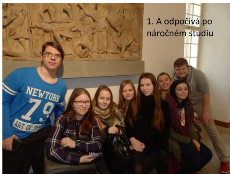
1. A odpočívá po náročném studiu